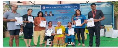
పతకాలను సాధించిన స్విమ్మర్లతో ఎగ్జిక్యూటివ్ క్లబ్ యాజమాన్యం

హైదరాబాద్ లో ఈ నెల 23వ ముగిసిన పాన్ ఇండియా మాస్టర్ నేషనల్ గేమ్స్ ఫెడరేషన్ కప్ ఈత పోటీల్లో ఉమ్మడి కృష్ణాజిల్లాకు చెందిన పలువురు స్విమ్మర్లు పతకాల పంట పండించారు.